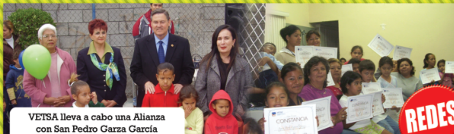
VETSA lleva a cabo una Alianza con San Pedro Garza García