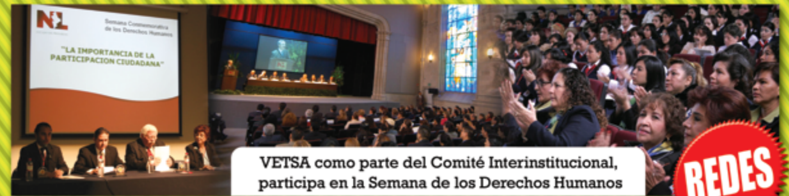
VETSA como parte del Comité Interinstitucional, participa en la Semana de los Derechos Humanos