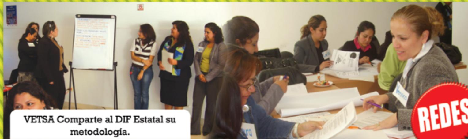
VETSA Comparte al DIF Estatal su metodología.