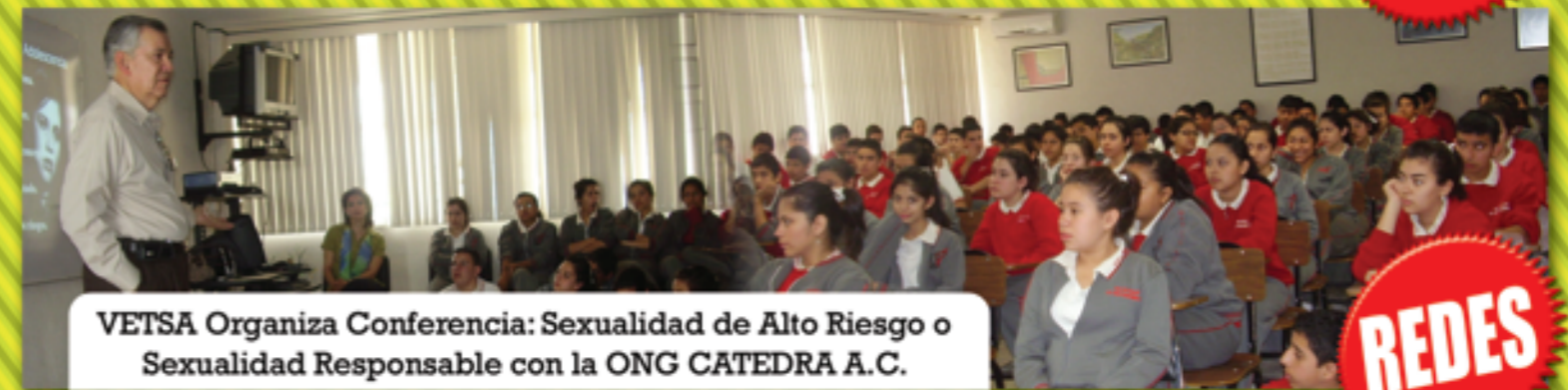
VETSA Organiza Conferencia: Sexualidad de Alto Riesgo o Sexualidad Responsable con la ONG CATEDRA A.C.