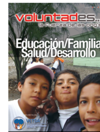
Diseño de portada: Humberto Daniel Niño P.

Voluntades es una publicación con derechos reservados. El contenido de los artículos es responsabilidad exclusiva de los autores. Queda prohibida la reproducción parcial o total del material publicado, sin consentimiento. DERECHO DE AUTOR: 04-2006-053017164600-102