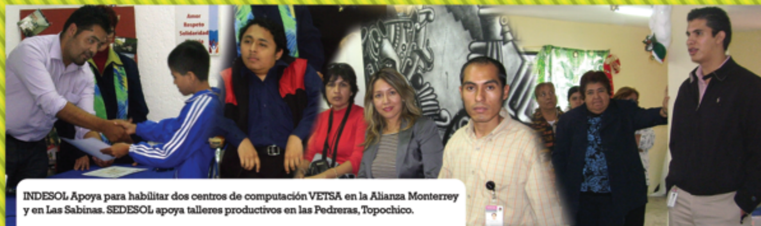
INDESOL Apoya para habilitar dos centros de computación VETSA en la Alianza Monterrey y en Las Sabinas. SEDESOL apoya talleres productivos en las Pedreras, Topochico.